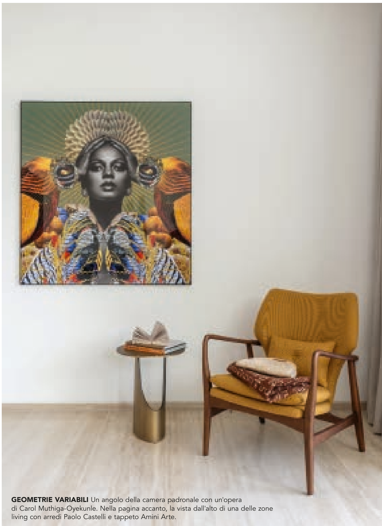
GEOMETRIE VARIABILI Un angolo della camera padronale con un'opera di Carol Muthiga-Oyekunle. Nella pagina accanto, la vista dall'alto di una delle zone living con arredi Paolo Castelli e tappeto Amini Arte.