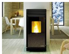
Palazzetti Stufa a pellet Driade Green Stone