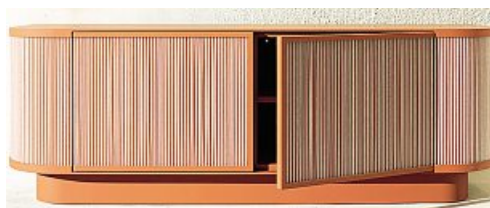
Ab Living Madia Uncidi, design Alberto Vismara