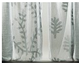
Medit Tenda ReLife in nylon rigenerato