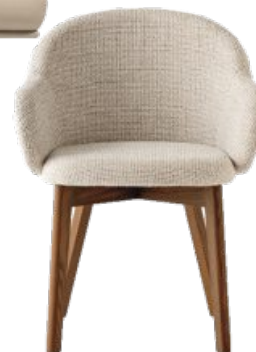
Calligaris Seduta HollyFab, design Busetti Garuti Redaelli