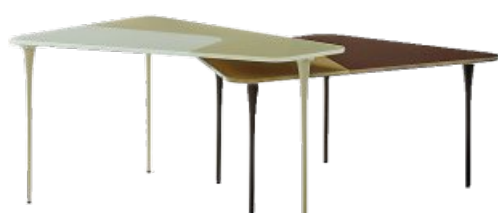
Nube Tavolino Raffles, design Marco Corti