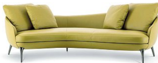
Minotti Divano Raphael, design Gamfratesi