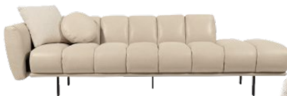
Cantori Divano Blockbau, design Maurizio Manzoni