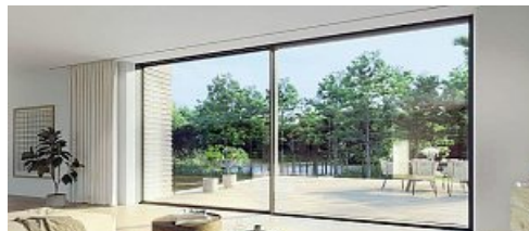
Schüco Sistema scorrevole panoramico Access Line

La proprietà intellettuale è riconducibile alla fonte specificata in testa alla pagina. Il ritaglio stampa è da intendersi per uso privato