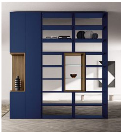
Zalf Sistema Freespace