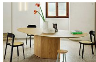
Miniforms Tavolo Monoplauto, design P. Cappello e S. Sabatti

La proprietà intellettuale è riconducibile alla fonte specificata in testa alla pagina. Il ritaglio stampa è da intendersi per uso privato