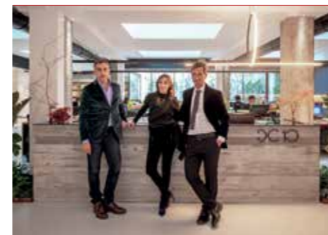
Studio DC 10 Architects

È uno studio giovane e dinamico, capace di coniugare gli aspetti artistico-stilistici al business plan dei committenti. Ne è testimone la fiducia che aziende come Leica e Giada, attente ai costi e all'immagine, rinnovano da anni allo studio, una fiducia conquistata anche grazie alle capacità esecutive e organizzative del team. L'impronta geografica di DC10 include Bruxelles, Istanbul e la Cina. Blend Tower, primissimo smart working italiano, e Science 14 nel quartiere europeo di Bruxelles sono opere firmate dallo studio. Copernico 38 a Milano è tra i progetti più recenti. www.studioc10.com