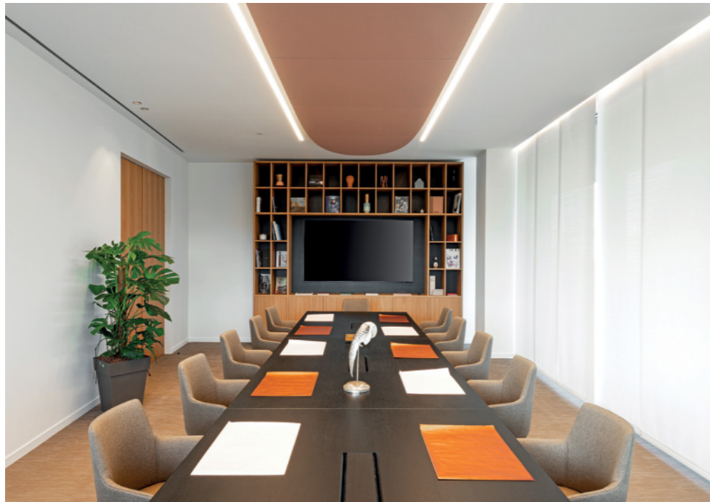
Legno e pareti bianche per le sale riunioni che parlano di chiarezza e sostenibilità, con gli arredi, il tavolo More e le sedute Divina. Tutto di Estel.