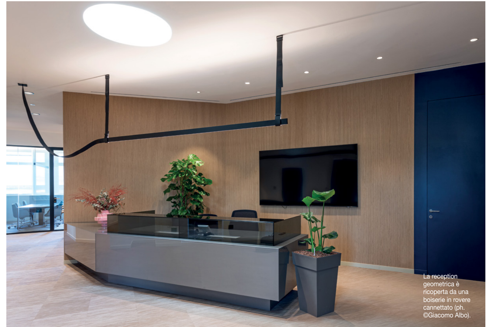
La reception geometrica è ricoperta da una boiserie in rovere cannettato.

UN VASTO UFFICIO FIRMATO DA GARIBALDI ARCHITECTS IN CUI IL FOCUS PROGETTUALE, LA DUALITÀ TRA SALE RISERVATE E AREE COLLABORATIVE, SI TRADUCE IN UNO STUDIO ATTENTO DI FORME, MATERIALI E FILOSOFIA DEGLI SPAZI