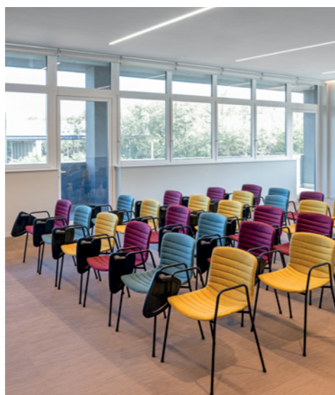
Le sedute Deep Plast Stripe di Quinti per le conference room. Materiali naturali, insieme a scelte cromatiche attente, contribuiscono a caratterizzare gli ambienti.