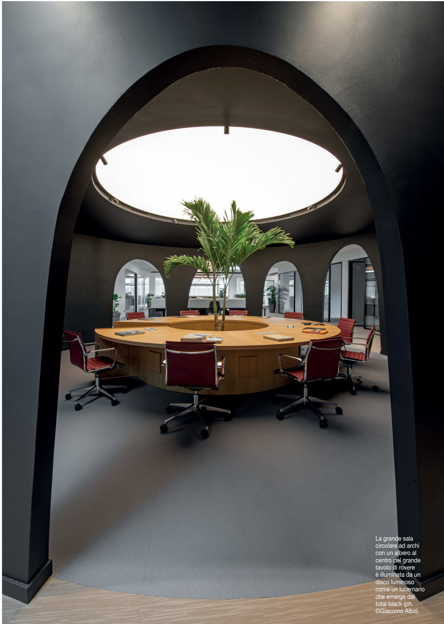
La grande sala circolare ad archi con un albero al centro del grande tavolo di rovere è illuminata da un disco luminoso come un lucernario che emerge dal total black.