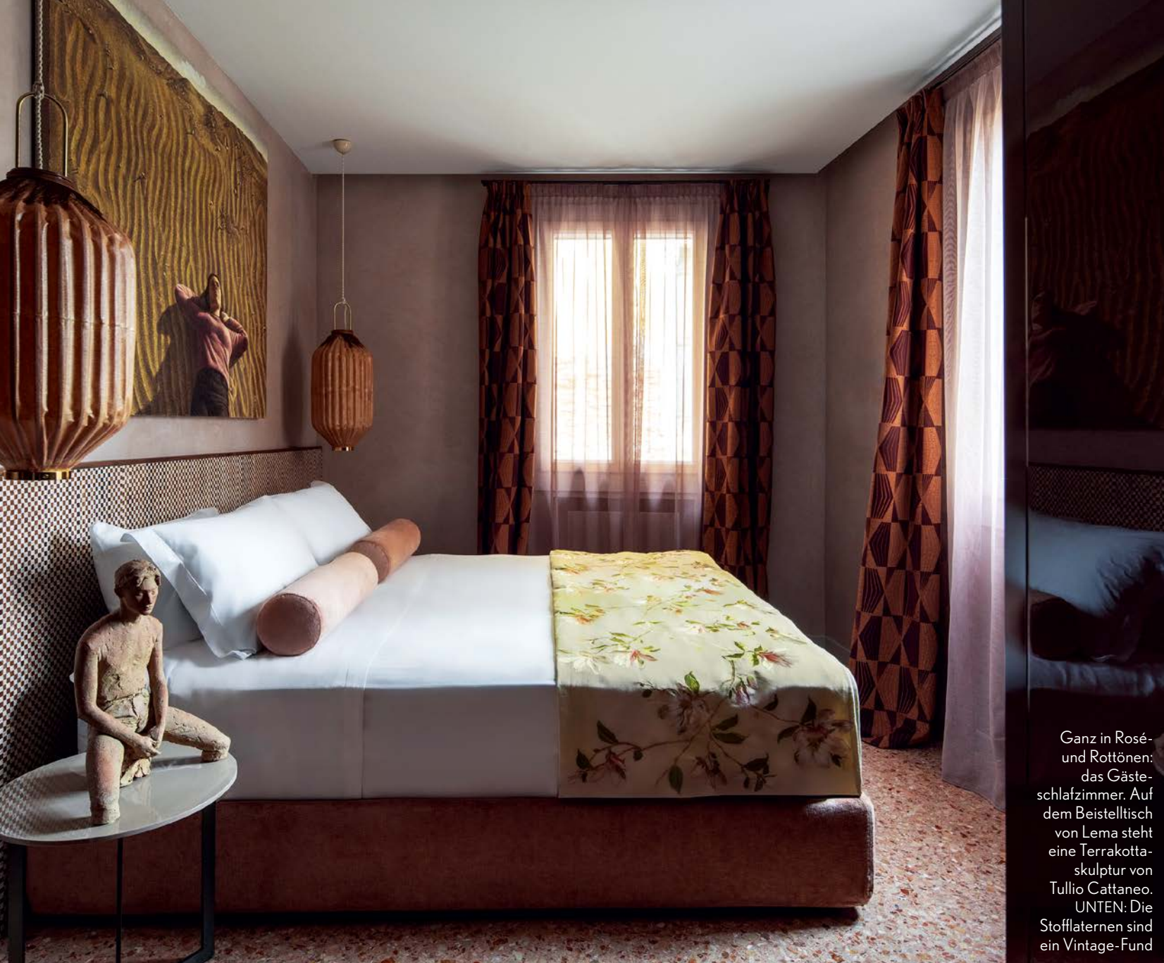
Ganz in Rosé- und Rottönen: das Gäste-schlafzimmer. Auf dem Beistelltisch von Lema steht eine Terrakotta-skulptur von Tullio Cattaneo. UNTEN: Die Stofflaternen sind ein Vintage-Fund