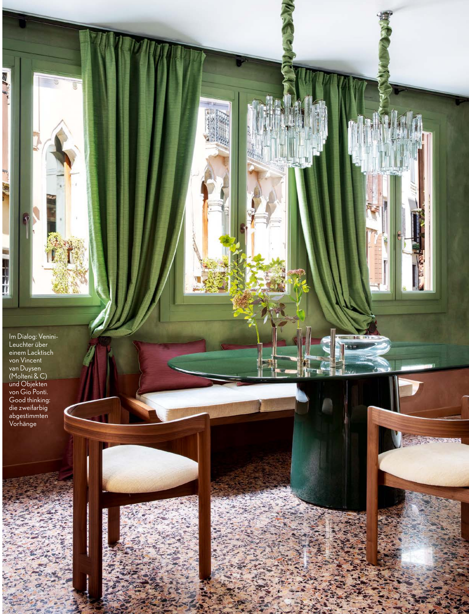
Im Dialog: Venini-Leuchter über einem Lacktisch von Vincent van Duysen (Molteni & C) und Objekten von Gio Ponti. Good thinking: die zweifarbig abgestimmten Vorhänge