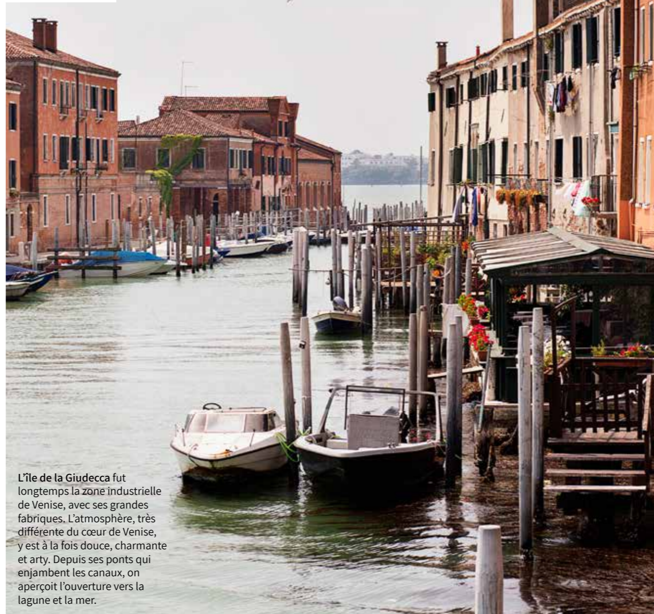
L'île de la Giudecca fut longtemps la zone industrielle de Venise, avec ses grandes fabriques. L'atmosphère, très différente du cœur de Venise, y est à la fois douce, charmante et arty. Depuis ses ponts qui enjambent les canaux, on aperçoit l'ouverture vers la lagune et la mer.

Annexe estivale (d'avril à octobre) de l'iconique Harry's Bar, Harry's Dolci offre, depuis sa terrasse, une vue idéale sur le canal de la Giudecca et les Zattere. On y savoure les classiques du menu des établissements Cipriani, et quelques plats très locaux, comme la soupe de haricots ou le foie de veau à la vénitienne, proposés par des serveurs en livrée et gants blancs. Un très élégant twist vintage. Fondamenta S. Biagio, 773.